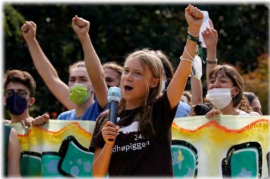
Greta Thunberg, 1er octobre 2021 à Milan

L'idéal serait qu'à l'issue du spectacle, les relations entre le collège et ces structures ressources soient devenues pérennes.