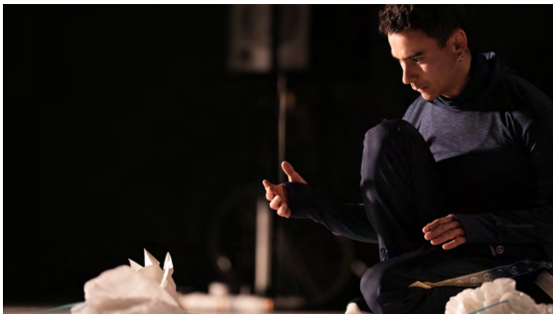
photos de répétitions - version scénique